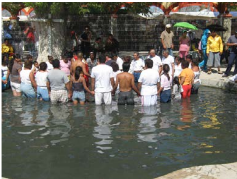
Foto 2: fidencistas en charquito en Espinazo.