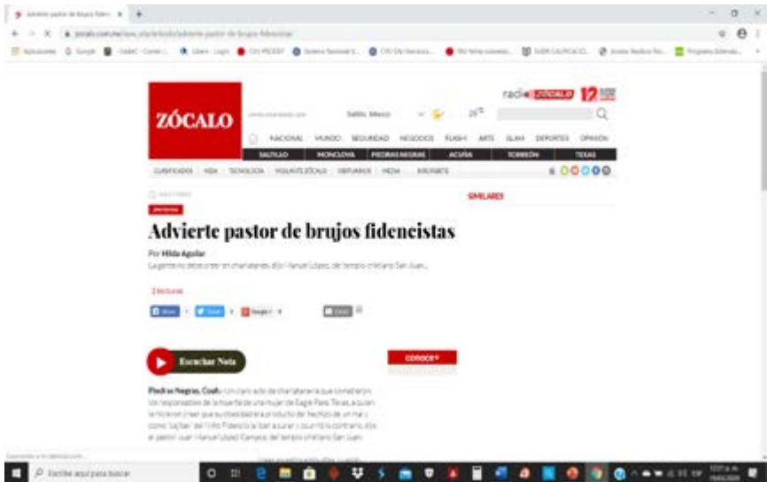
Foto 15: Captura de pantalla de la nota titulada “Advierte pastor de brujos fidencistas” publicada en el diario “El Zócalo Saltillo”, el 26-07-2012.