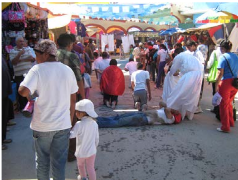
Foto 1: devoto del Niño Fidencio rodeando hasta la casa del Santo en Espinazo.