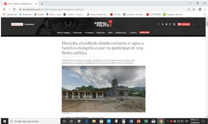
Foto 5: Captura de pantalla de una nota (11 de julio 2019) del diario “Animal político” sobre la interrupción del servicio de abastecimiento del agua en el pueblo de Huejutla (en el Estado de Hidalgo).