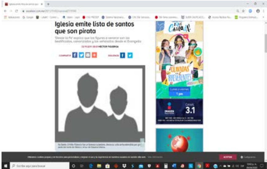
Foto 13: Captura de pantalla de la nota titulada “Iglesia emite lista de santos que son pirata” publicada en el diario “Excelsior”, el 02-11-2011,

A un cierto punto, el autor de la nota menciona la opinión sobre este tema de un sacerdote católico, quien sostiene que: “Los falsos santos se deben distinguir de los verdaderos, pues no hay razón para venerarlos y los verdaderos no deben ser mezclados con supersticiones. Sólo es válido admirar a un santo si éste nos inspira a vivir heroicamente el Evangelio de Jesucristo”. Además de sostener abiertamente que estas devociones son “falsas” (y por lo tanto negando su derecho a existir), es interesante notar como el presbítero defina a estas últimas utilizando un término muy común en las críticas-entrevistas de sacerdotes católicos sobre religiones minoritarias que la iglesia no acepta, el de “superstición”, término cuyas implicaciones negativas he ya discutido arriba, con respecto a las notas locales. Además, en la nota se reporta que el sacerdote sostiene que esas “fal-