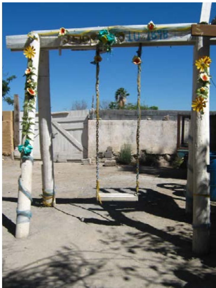
Foto 12: El columbio en el cual el Niño Fidencio curaba varios tipos de enfermos en Espinazo.