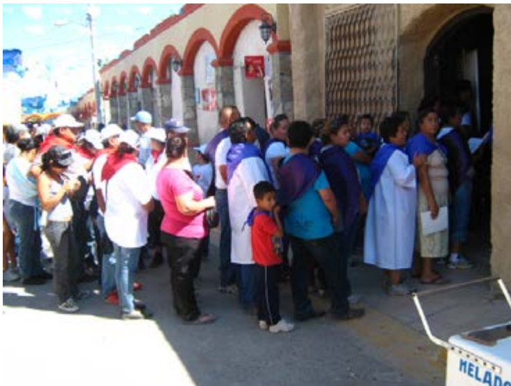
Foto 10: Devotos formados en espera de acceder a la casa del Niño Fidencio en Espinazo.