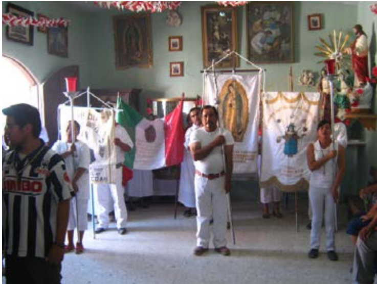
Foto 9: Devotos que saludan al Niño Fidencio dentro de su casa, en Espinazo. Autor: Francesco Gervasi