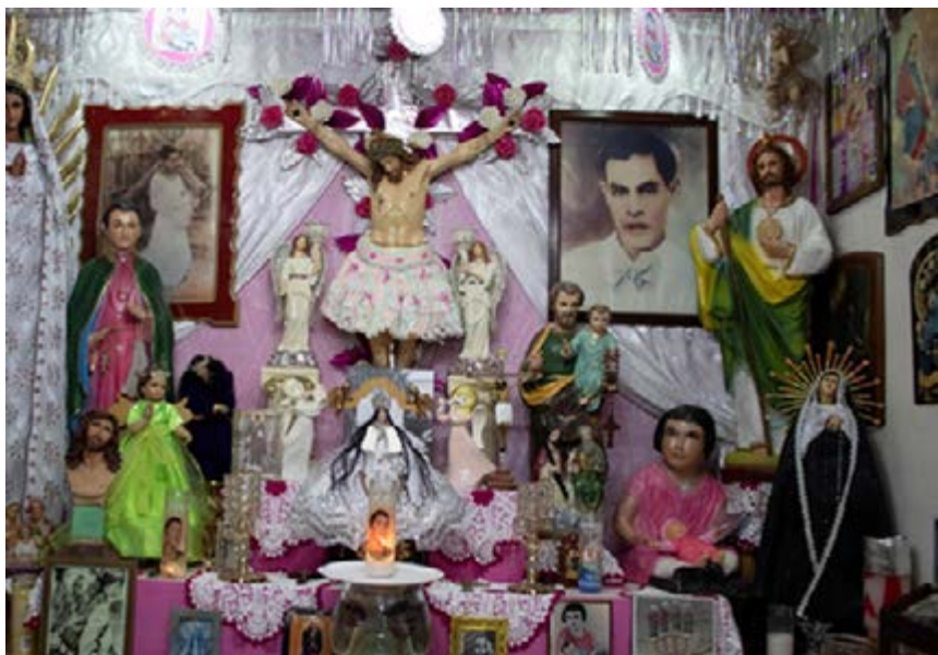
Foto 6: Altar dedicado al Niño Fidencio con otros santos católicos y también a Jesús Cristo y la Virgen de Guadalupe. Autor: Alonso Montenegro Martínez

Entre otras cosas, los altares confirman que la mayoría de los fidencistas (por lo menos los que hemos entrevistado en Saltillo) se sienta católica, porque en ellos (en los altares), además de la figura de Fidencio, aparecen otros santos y, a veces, hasta Jesús Cristo y la Virgen de Guadalupe, como se puede observar en la siguiente foto: