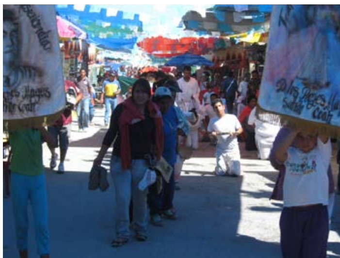
Foto 8: Devoto que va llegando de rodillas a la casa del Niño Fidencio en Espinazo.