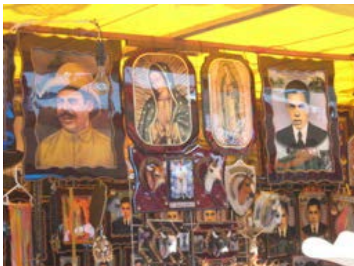
Foto 7: Imágenes en venta del Niño Fidencio y de otros santos, en el mercado en Espinazo.