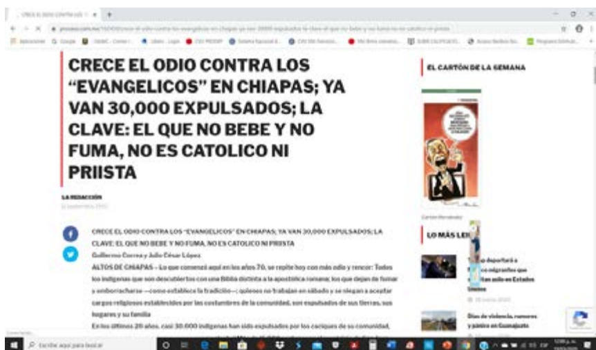
Foto 4: Captura de pantalla de una Nota (11 septiembre 1993) de la revista Proceso sobre el odio creciente en contra de los evangélicos en Chiapas.

poco o nada libre para expresar sus creencias, cultos o ritos en su comunidad. Sin embargo, los resultados más preocupantes son que el 41.7% sostiene que ha experimentado, en los últimos 5 años, al menos una situación de discriminación y que más de la mitad (el 53.1%) de los entrevistados sostiene que ha sido rechazado por la mayoría de la gente. En otras palabras, parece que los resultados de la encuesta del 2017 tienden a confirmar una situación bastante problemática para las minorías religiosas presentes en el país, tanto en las percepciones de los integrantes de los grupos religiosos minoritarios como en las declaraciones de los entrevistados en general. En ambos casos (es decir tanto con base en las experiencias de los integrantes de religiones minoritarias como en las afirmaciones de los entrevistados en general), emergen respuestas que, por lo menos desde el punto de vista cualitativo, reflejan una escasa apertura a la diversidad religiosa presente en el país.