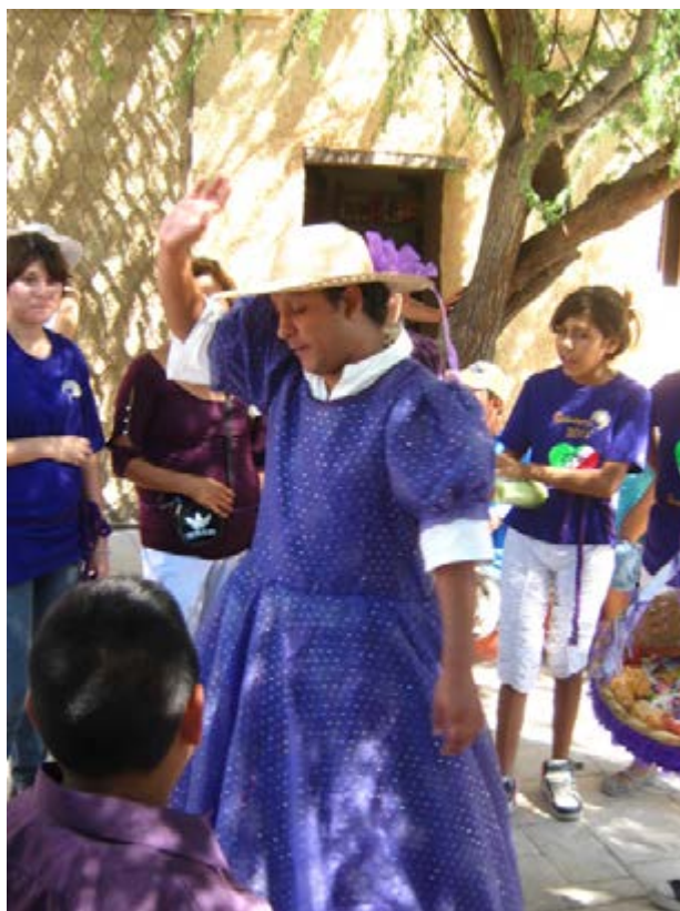
Foto 11: Materia del Niño Fidencio en Espinazo, vestida con ropa femenina porque, según sus devotos, el santo tenía voz y comportamientos “femeninos”, hasta llegar a afirmar que fue homosexual. Autor: Francesco Gervasi