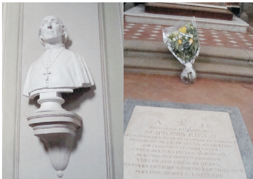
Le foto riproducono il busto di Scipione de Ricci che si trova presso la cappella della Villa di Rignano e il mazzo di fiori apposto ai piedi dell'altare della cappella.