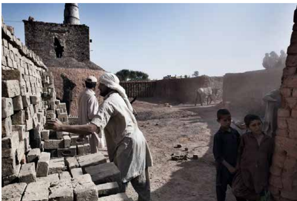
OPERAI AL LAVORO IN UNA FORNACE