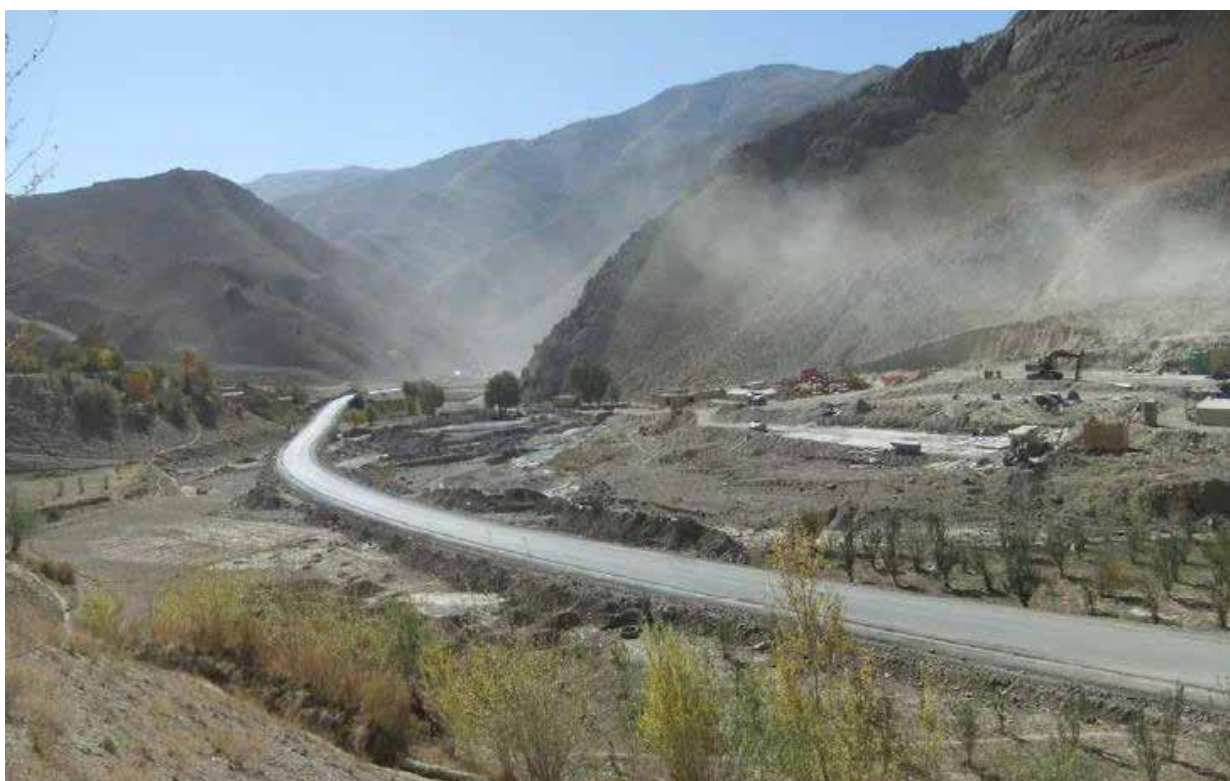
KABUL, UN TRATTO DELLA STRADA REMABAR