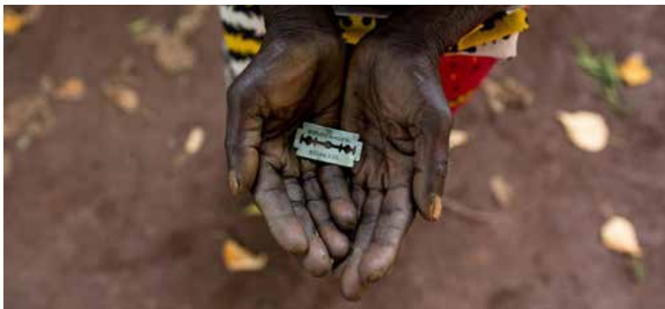
UNA DONNA MOSTRA UNA LEMETTA UTILIZATA PER LE MUTILAZIONI A MOMBASA, KENYA