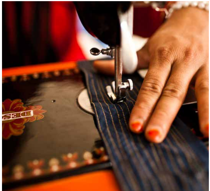
UNA DONNA FREQUENTA UN CORSO DI CUCITO

La strada, i cui lavori saranno interamente conclusi nell'agosto 2016, è stata realizzata grazie a un contributo italiano di oltre 100 milioni di euro e, con i suoi 136 chilometri, costituisce la parte orientale dell'asse centrale di attraversamento del paese, servendo circa un milione di abitanti tra le province di Maidan-Wardak e Bamiyan. Prima dell'intervento di ricostruzione, per percorrere il tragitto tra Kabul e Bamiyan si impiegavano dieci ore; il tracciato era chiuso durante l'inverno e in condizioni di cattivo tempo a causa di frequenti inondazioni e frane. Oggi, lo stesso tratto si percorre in sole tre ore, diminuendo così i costi di trasporto e di manutenzione dei veicoli e permettendo a insegnanti e medici di raggiungere più facilmente i villaggi dell'entroterra. Grazie a Remabar, la frequenza scolastica di bambini e bambine è aumentata, è migliorato l'accesso delle donne ai centri sanitari e lungo la strada sono sorte diverse attività commerciali. Oltre alle iniziative nel settore delle infra-