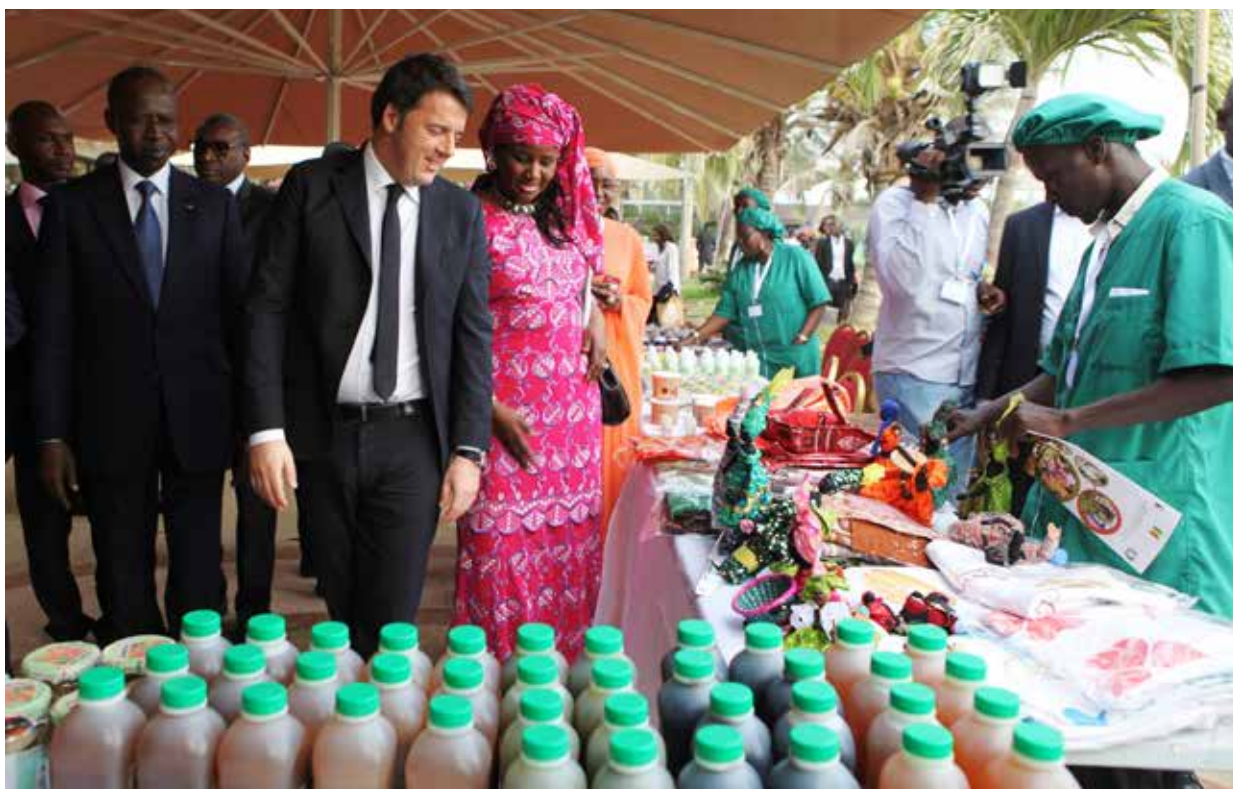
RENZI VISITA LO SPAZIO ESPOSITIVO DEI PRODOTTI LOCALI