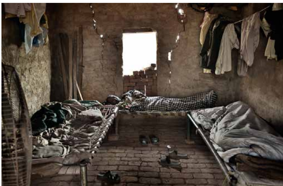
© LAURA SALVINELLI. UN MOMENTO DI RIPOSO