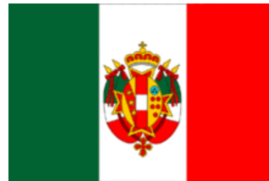
La bandiera del Granducato nel 1848: il tricolore, con sovrainpresse le armi della casata degli Asburgo-Lorena