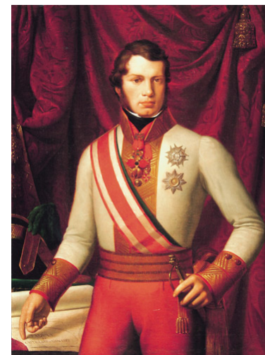
Pietro Benvenuti Ritratto di Leopoldo II di Toscana , 1828

Ore 15.00 Maria Pia Paoli , Scuola Normale Superiore di Pisa, Politica e cultura in Toscana al tempo dei Lorena