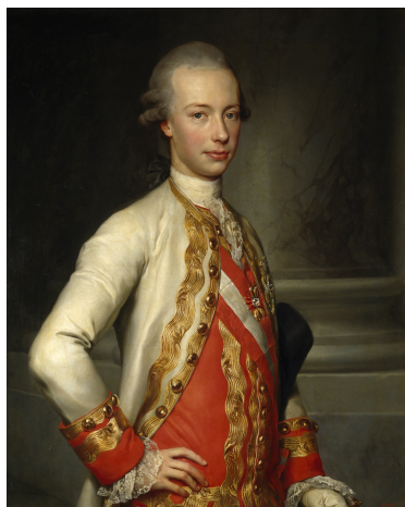
A.R. Mengs Ritratto di Pietro Leopoldo, 1770

Ore 10.15 Giovanni Cipriani , Università di Firenze, Introduzione generale al tema del seminario