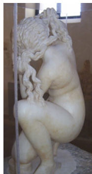
Venere Rodia / Museo Archeologico di Rodi

Per questo, sarebbe troppo semplice ridurre il tema della bellezza alle contingenze del momento o alla storia interna delle arti; al contrario, affrontare oggi questo tema significa accettarne tutte le dimensioni in cui si articola e che costituiscono la pragmatica della nostra vita quotidiana in cui si mischiano senza sosta memorie collettive e individuali, linguaggi e lingue diverse, paure e speranze, timori e tremori. Non importa l'approccio scelto per parlarne, ciò che importa è sapere che comunque ne va della nostra speranza di futuro.