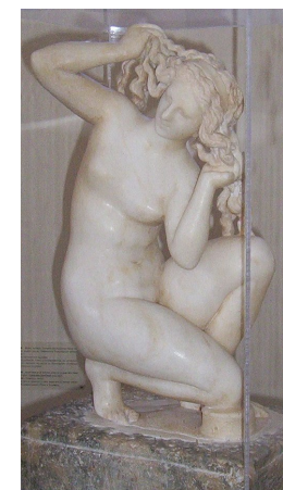
Venere Rodia / Museo Archeologico di Rodi