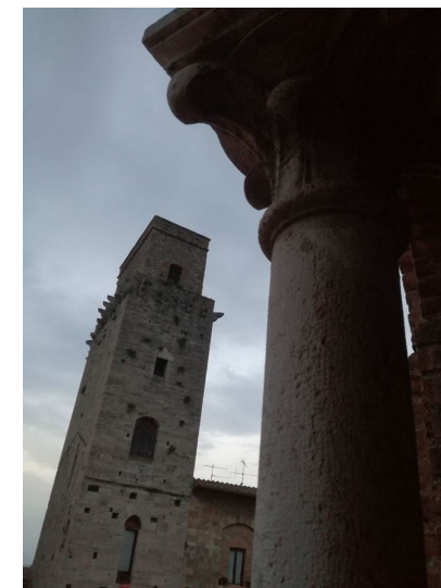
San Gimignano