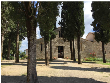
La Pieve di Cellole

Monastero di Cellole > Loc. Cellole – 53037 SAN GIMIGNANO