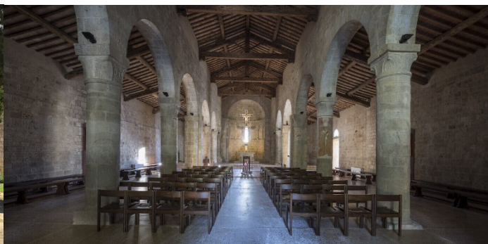
Interno della Chiesa di Cellole