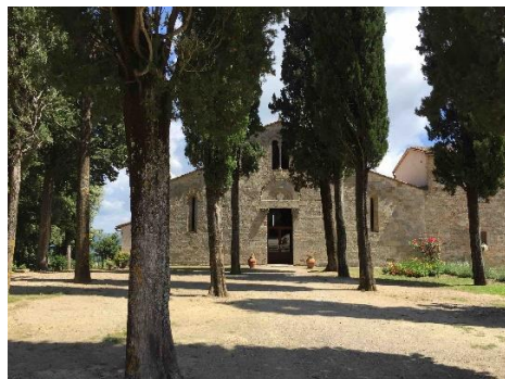
La Pieve di Cellole