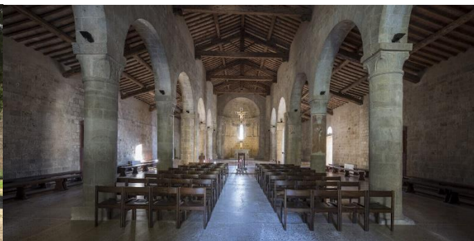
Interno della Chiesa di Cellole